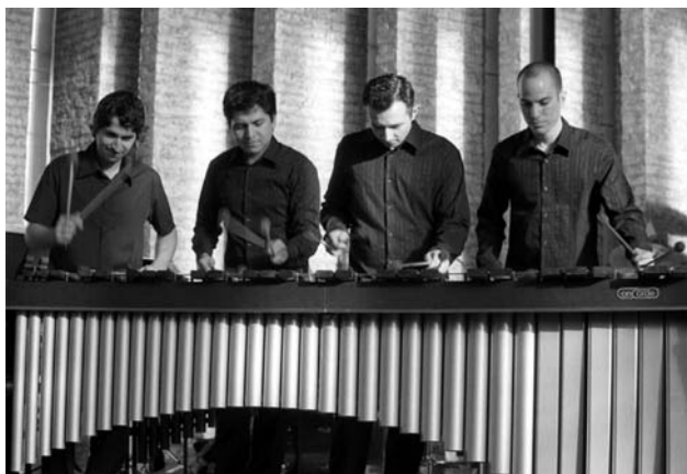
Članovi ansambla Ear Massage