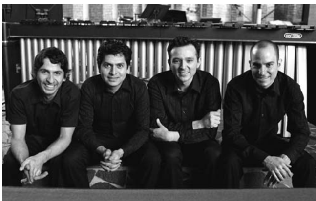
Ansambl Ear Massage

Četvorica perkusionista iz Latinske Amerike sa prebivalištem u Holandiji osnovali su ansambl Ear Massage u decembru 2004. godine. Opredeljujući se za izvođenje savremene muzike, repertoar ovog sastava obuhvata široki spektar stilova i žanrova. Pove-