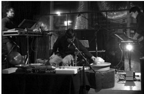
Ansabl The Electronic Hammer